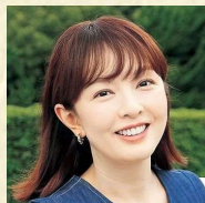
フリーキャスター 丸岡 いずみ氏